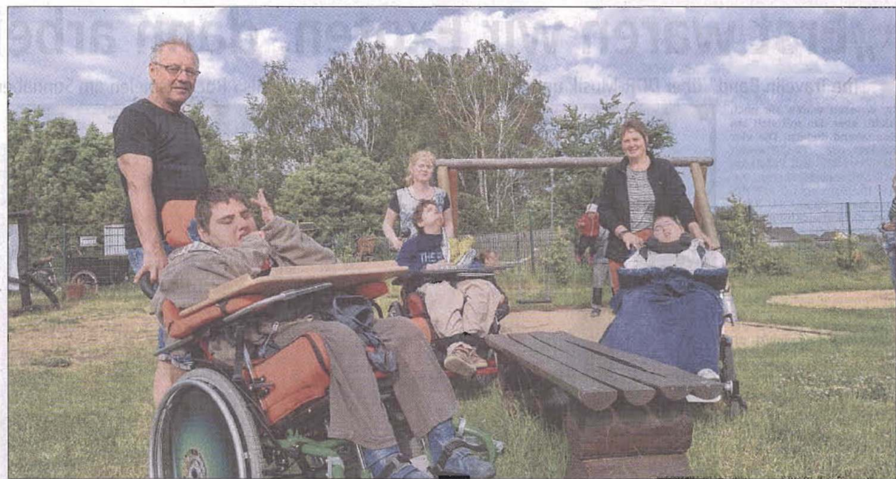
Im Oderbruchzoo immer wieder gern begrüßt: die Schüler der Paul- und Charlotte-Kniese-Schule Berlin-Lichtenberg (hier bei ihrem Besuch vor einem Jahr). Sie gehören zu den Stammgästen der Einrichtung. Jetzt werden neue Schlafgelegenheiten für die Gäste benötigt.